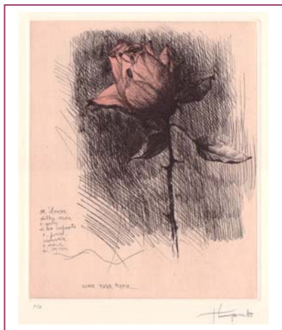
Una rosa rosa – T. Longaretti

Un'occasione rara d'incontro culturale con le Associazioni Culturali presenti in Valle Serina e con gli Enti che appoggiano e divulgano l'iniziativa culturale.