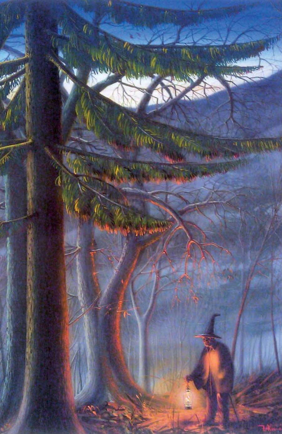
Diogene , opera di Filippo Alcaini