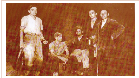
“Compagnia” di Minatori in pausa all'interno della miniera (1960)